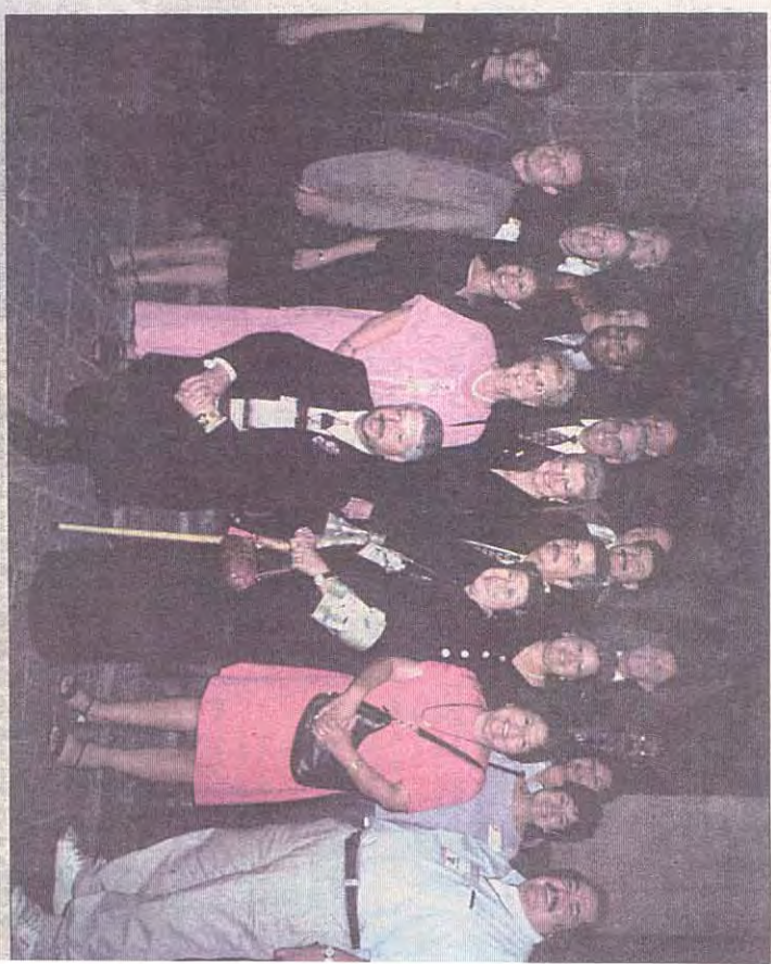
Kansas City Mayor Kay Barnes (center) is surrounded by the delegation in City Hall in Guadalajara. Barnes led the trade mission, was important to bring new jobs to Kansas City and new business opportunities for both countries. Kansas City Hispanic News was the only local media to travel with the delegation from Guadalajara to Morelia. In the next issue, the photos mentioned here were held in the city of Morelia will be shared.

El 4 de Octubre, el presidente de los municipios (Alcalde) Fernando Garza Martínez, dijo la bienvenida en su ciudad a la ciudad hermana de Kansas City. El día 4 de Septiembre involucra a todo el mundo y acarrea tensiones a toda