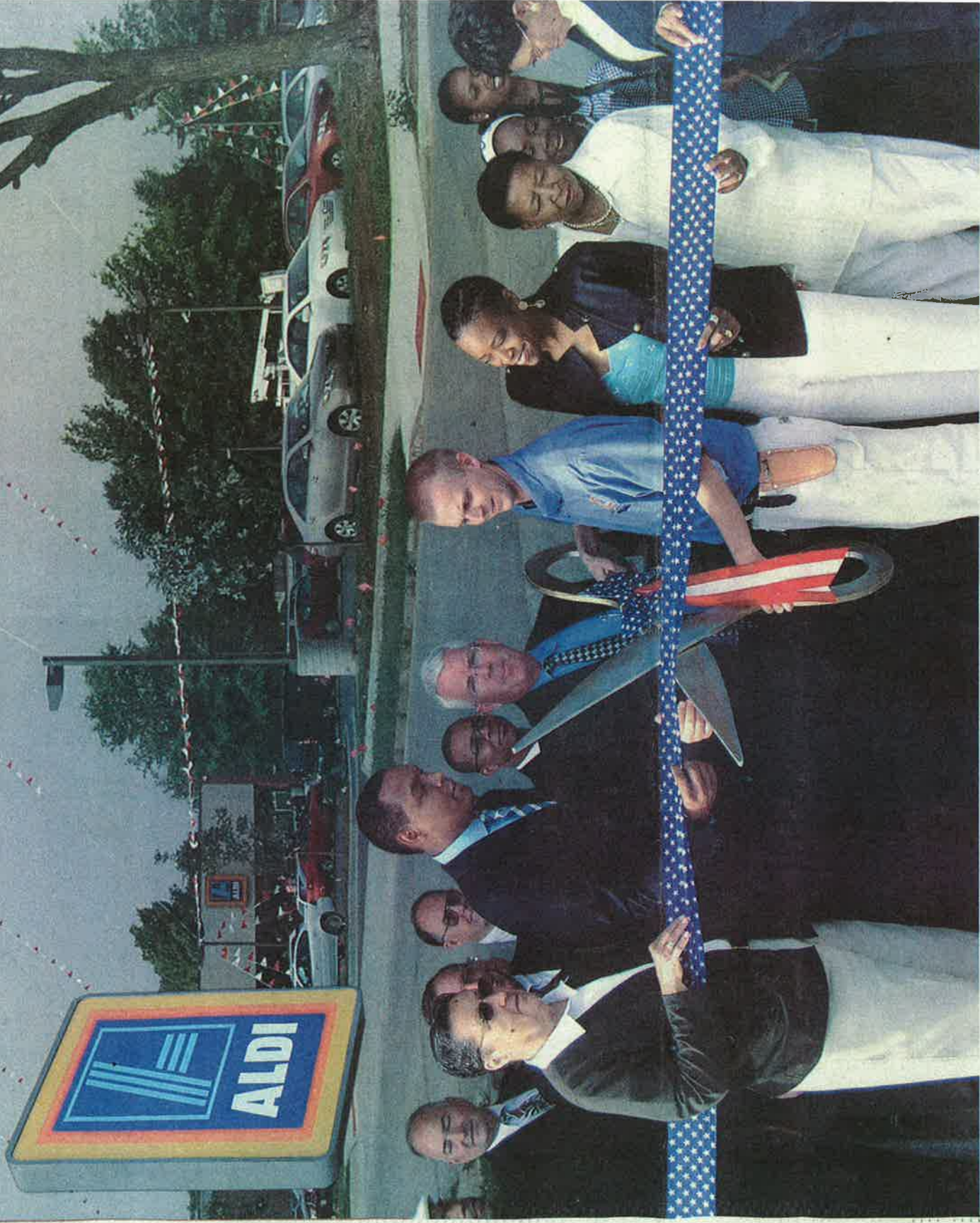
Banners and balloons were visible on Paseo Blvd. July 2. ALDI owners celebrated the opening of a new grocery store with a ribbon cutting ceremony. City officials and community leaders were on hand to officially welcome the retailer to the community. Banderas y globos se hicieron visibles el 2 de julio en el Paseo Blvd. Los propietarios de ALDI celebraron la apertura de una nueva tienda de abarrotes con una ceremonia de corte de cintas. Funcionarios del ayuntamiento y líderes comunitarios se encontraron presentes para darle la bienvenida oficial a la comunidad del comercio detallista.

JOE ARCE AND JUANA SUMMERS HISPANIC NEWS