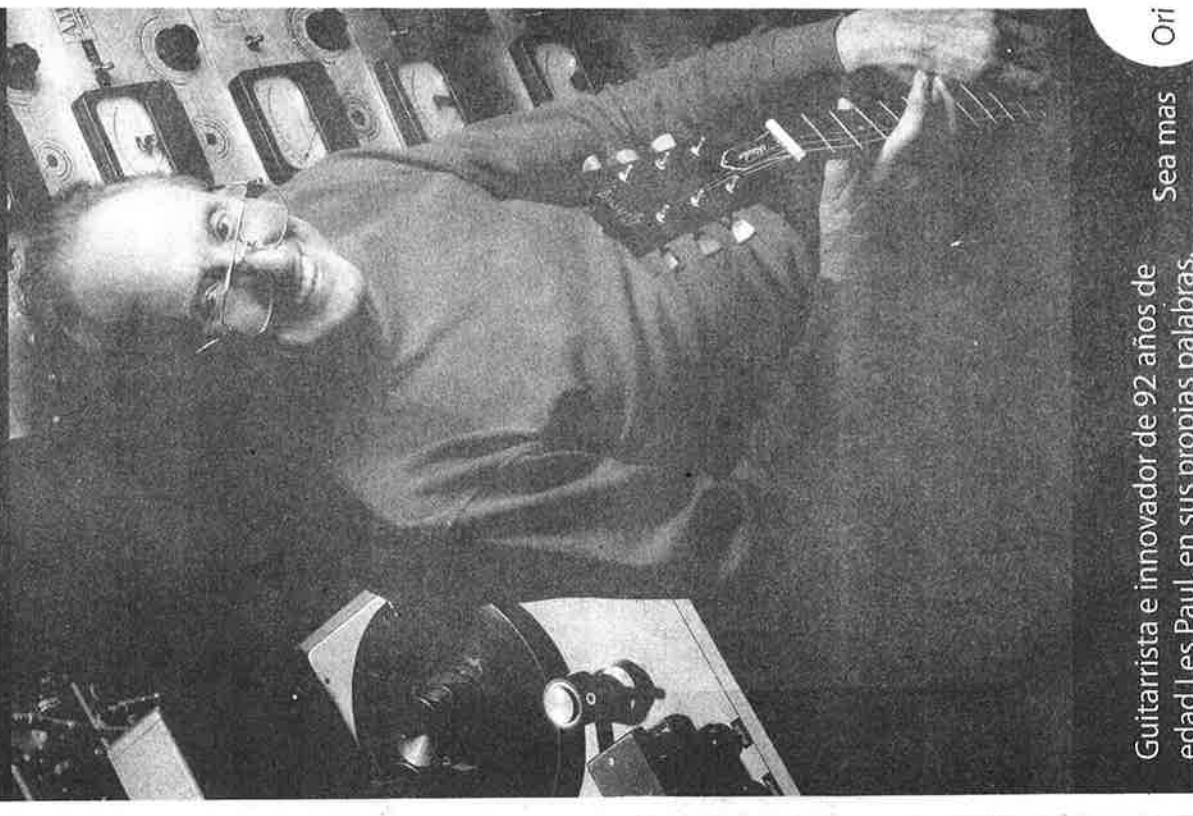
Guitarrista e innovador de 92 años de edad Les Paul, en sus propias palabras. Sea mas Ori